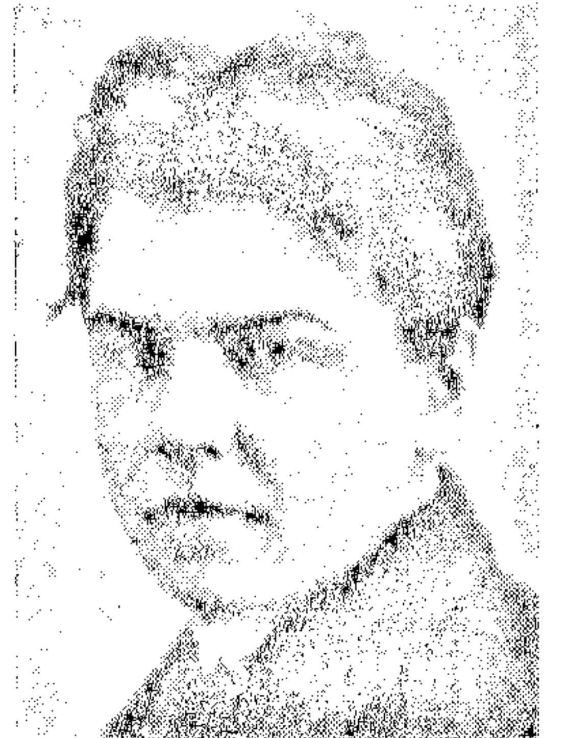
Председатель ВССС ЛЕОНИД ЛЕОНОВ